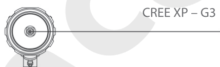
CREE XP – G3